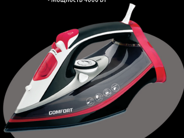
Электрический утюг модель: CSI-501