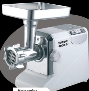
Мясорубка модель: L4000