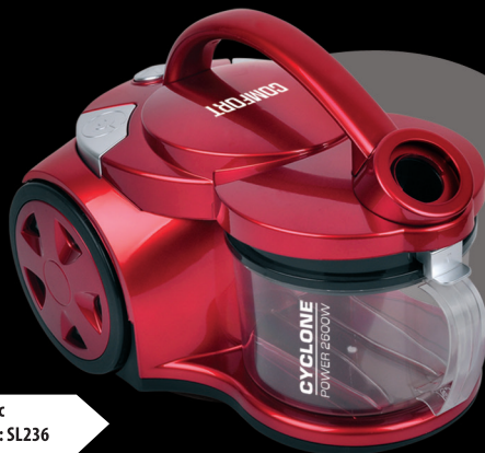
Пылесос модель: SL236