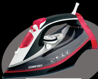
Электрический утюг модель: CSI-501