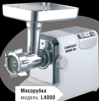
Мясорубка модель: L4000