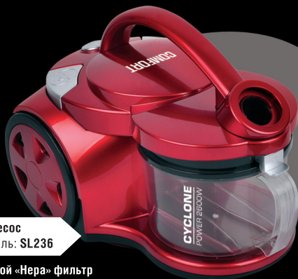
Пылесос модель: SL236