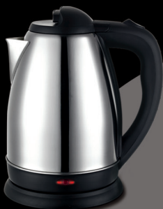
Электрический чайник модель: COMFORT 328