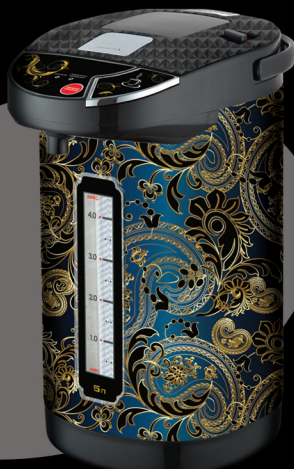
Чайник с функцией термоса артикул MD-603