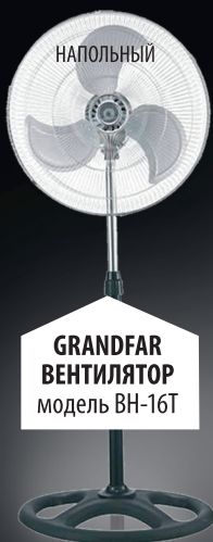
GRANDFAR ВЕНТИЛЯТОР модель VN-16T