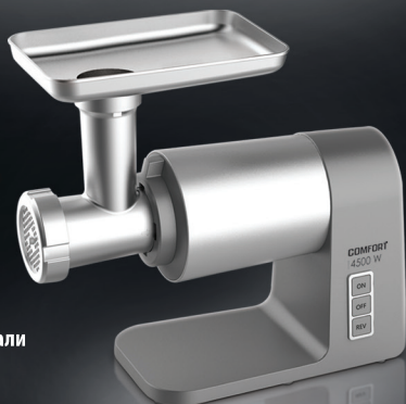
COMFORT МЯСОРУБКА модель CMG-005