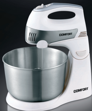
COMFORT МИКСЕР модель M-925