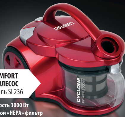
COMFORT ПЫЛЕСОС модель SL236