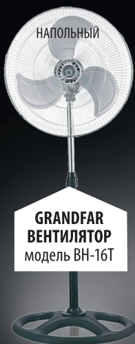
GRANDFAR ВЕНТИЛЯТОР модель BH-16T