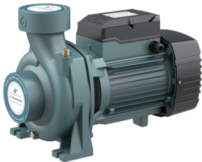
GRANDFAR МНОГООРУБЕНЧАТАЯ АВТОМАТИЧЕСКАЯ МИНИСТАНЦИЯ ПОВЫШЕНИЯ ДАВЛЕНИЯ модель SILENCER 500